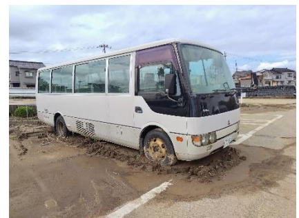
写5 市役所駐車場が冠水。駐車場は周りより一段低い。駐車車の車は背シートまで泥。泥水がどの高さまで到来かは不明。

市役所付近を流れる川原田川では、上流域での山の斜面崩壊によりなぎ倒された樹木が一気に押し流され河原田川を下り、市役所の東側にある橋(上新