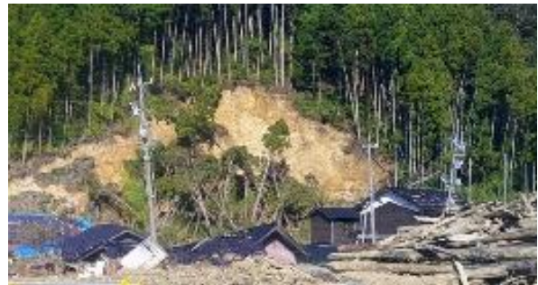
写4 町野町の内陸部；斜面崩壊と家屋被害

・町野町の水害は、曾々木以外では、町野川が一部堤防破損による洪水や、山麓地における斜面崩壊で家屋倒壊がいくつもあった(写4)。