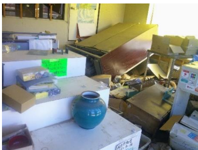
写7 商店の物品散乱の室内 浸水により浮いた大型冷蔵庫 は水がひいた時に転倒

・海岸付近の川原田川左岸域では、浸水域が狭い範囲であったので、浸水には至らなかった。仮設住宅も無