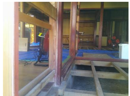
写9 住宅床下を乾かす 左柱裏に大型扇風機可動中

面について、まずは泥をかき出し、次に扇風機で十分乾燥させてから泥を掃き出し(取り出し)、その後掃除機で細かな