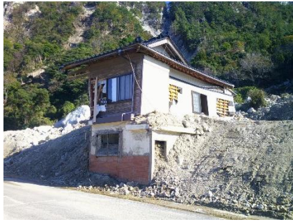
写1 曾々木での谷筋の土石流岸に横たわる急峻な山の谷筋がレ場からの土石流。民家の横には巨石。住宅の1階が土砂で埋る。住宅横の法面には重機の土砂撤去跡。