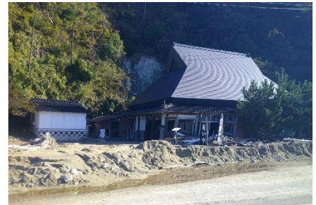
写3 真浦での土石崩壊、民家損傷

も曾々木の場合と同じように谷筋の土石崩壊被害があったが(写3)、巨石の落下がないところを見ると、曾々木海岸の様子と比較して、崩落のパワーが低いように見えた。曾々木の方は、堆積ガムができていなかったのでは、とのこと。実際のところは未確認。