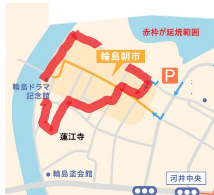
図2 輪島朝市の延焼域 by 輪島朝市HPに加筆

行政に対し、市民の声を聞いて問題対処に取り組むことを要求するのは市民側としては当然である。こうした要求が全国津々浦々、平時からも日常的に計画時点からの市民参加が定着することを願う。その際に考える基本には、復興に際しては仮設という状態は好ましくなく、常に本設とすべきであり、例えば、住宅については、仮設住宅ではなく初めから本設住宅を目指すべきである。