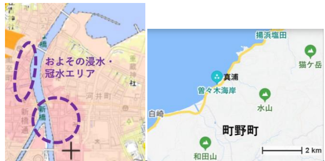
図1 輪島河井町の浸水冠水域、町野町曾々木と珠洲市真浦 by aakura Home Inspection HP by yahooMapに加工

地震被害は奥能登全域に特に被害がひどかった。一方、水害も奥能登全体を襲ってはいるものの、甚大な被害は局所的であり、本稿では視察を二地域に限定した(図1)。一つは輪島市の市役所を中心とした範囲と、二つは輪島市町野町曾々木海岸および隣接する珠洲市真浦町の海岸である。