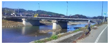
写8 上新橋にて流木が川を堰止め 上写10/24;枝等がひっかかり。 下写11/8;ではひっかかり材を 撤去。仮水道管の設置

の視察時には完全に除去されていた。また、仮設の水道管も橋桁の下端に新たに設置されていた。