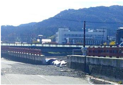
写6 河原田川右岸の堤防破損壁