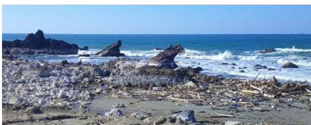
写2 曾々木海岸；土石流と共に谷筋を下り海に流された樹木が海岸に打ち上げられた

崩落が起こるかは分からないので、住民はもうここには住めない、と力なく言っておられた。