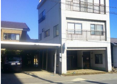
写 10 浸水後、泥かき出しの床 (左建物)と放置の床(右建物)

・床上浸水の住宅では、床上は雑巾なども何度もふき取っていたという。我ら大箱 2 箱分の雑巾を持参し必要な方に提供したところ、後にその方々が言われるには、あっという間に雑巾をすべて使い切ったとのこと。雑巾使用に際して、初めの 2～3 回(ひどい時は数十回)の拭き取りで泥だらけ雑巾を廃棄し、4 回めくら