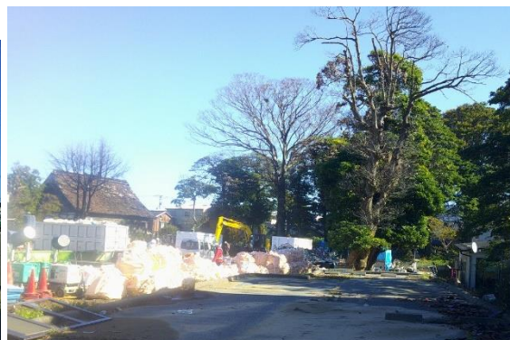
写12 延焼域南端、樹木が延焼防止に一役