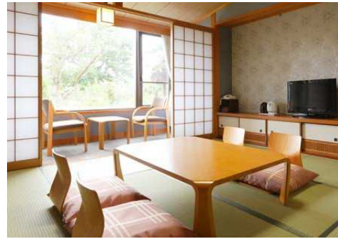
ホテル部屋イメージ