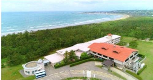
宿泊施設：能登千里浜休暇村