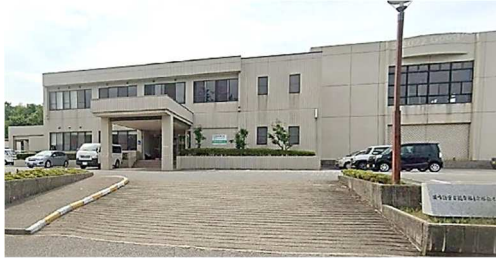
講座会場：羽咋勤労者総合福祉センター