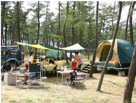
キャンプイメージ