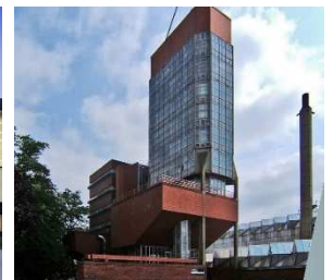
レスター大学工学部棟