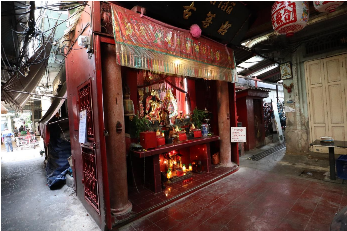
街区内側に残る中国系の廟。