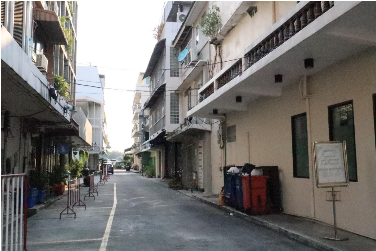
街区の通りからチャオプラヤ川へ抜ける眺望。