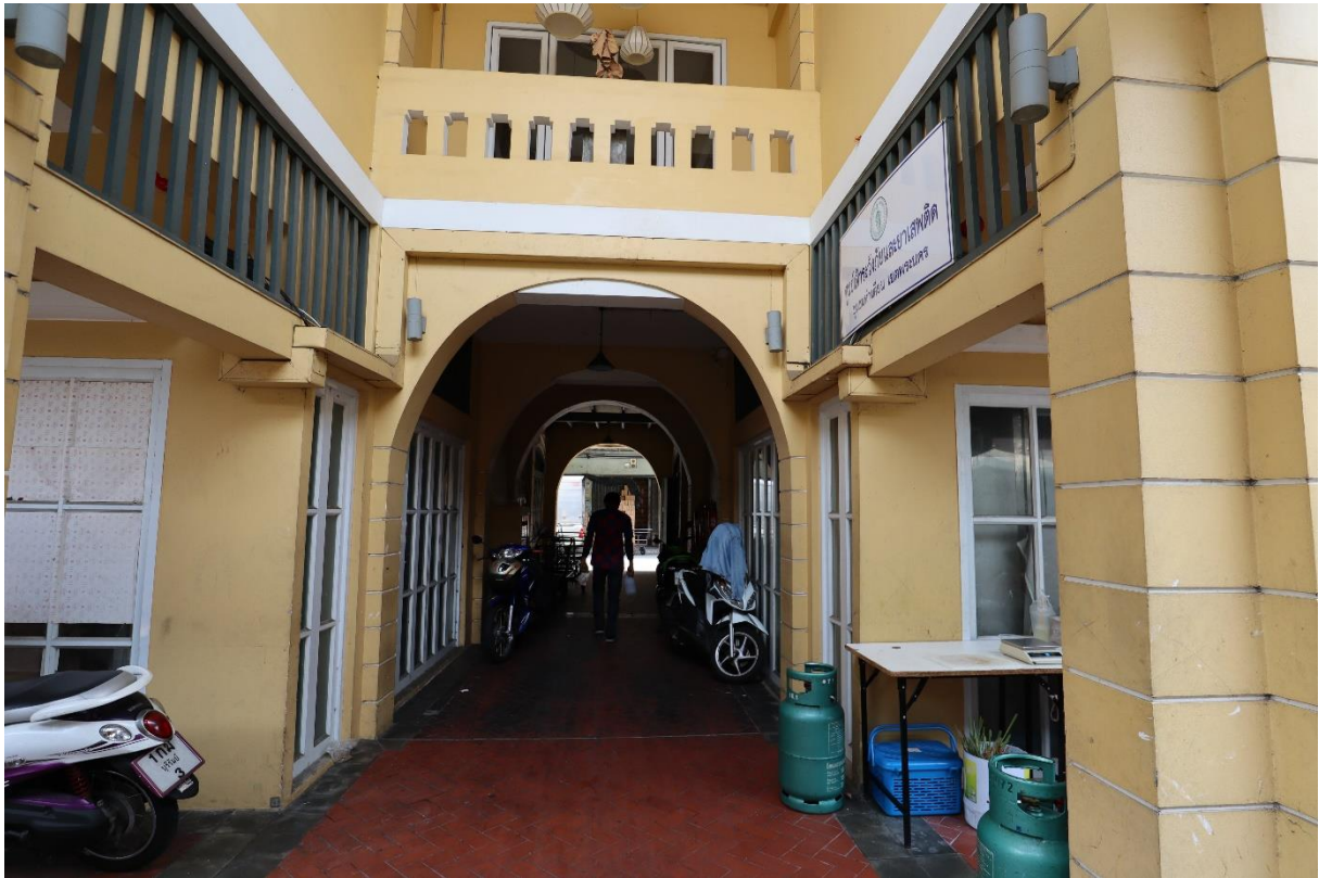
修復された街区内側の入り口。内側では、昔からの生業や生活が継続している。