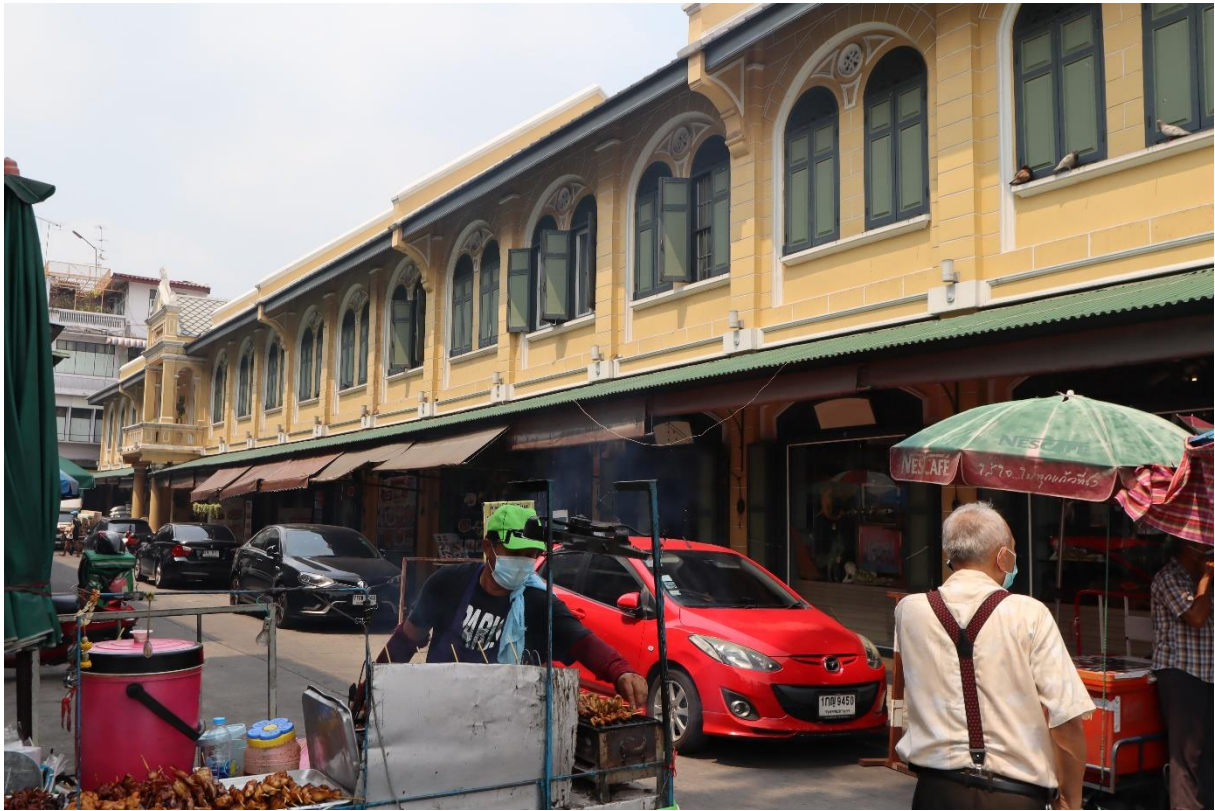
ショップハウスの外観は修復され、色彩が再現されている。