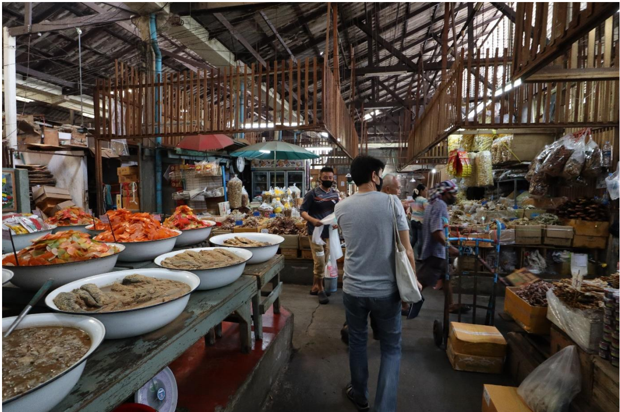
街区内側の市場エリア。昔から扱われていると思われる産品が並んでいる。