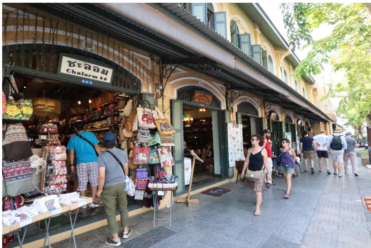
再生事業後のターティアン地区。表側には土産物屋などが並ぶ(コロナ禍の前)。