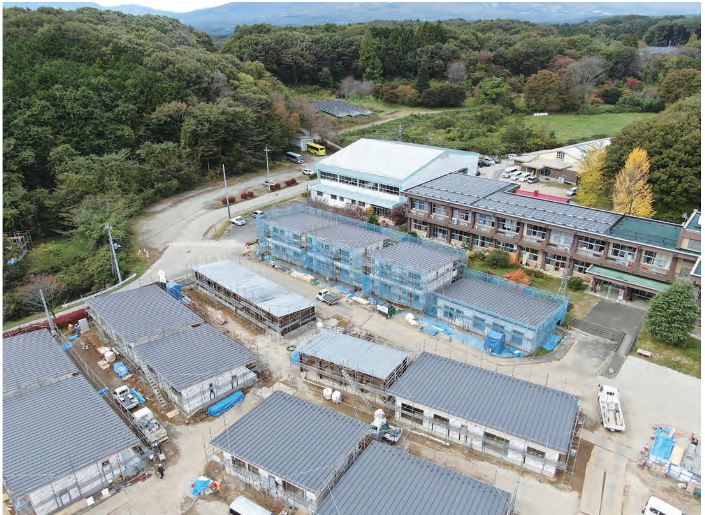
写真12 工事中の自立のサ高住