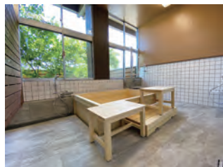
写真4(左) ひろばの家・那須3、写真5(中央) あさひのお宿、写真6(右) 檜風呂