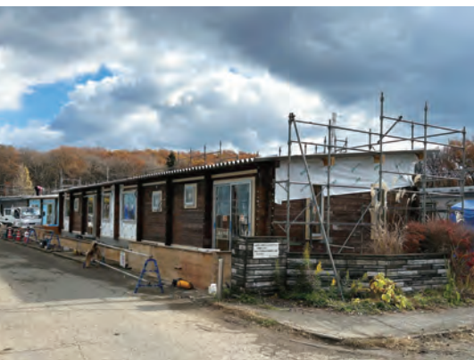
写真13 (2点ともに) 震災復興住宅骨格の再利用