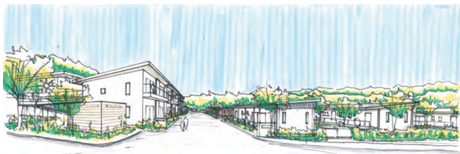
図4 戸建て感覚の集合住宅スケッチ

近山 おっしゃるように大規模で建設費は4.5億円を超えています。建設開始前に事業収支のシミュレーションを積み重ね、誘致した店舗や事務所などのテナントも予定通り入居。その結果、2022年5月に累損を一掃し黒字転換しました。