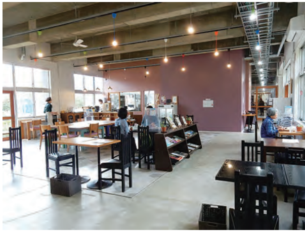
写真2(左) コミュニティカフェ「ここ」、写真3(右) マルシェ