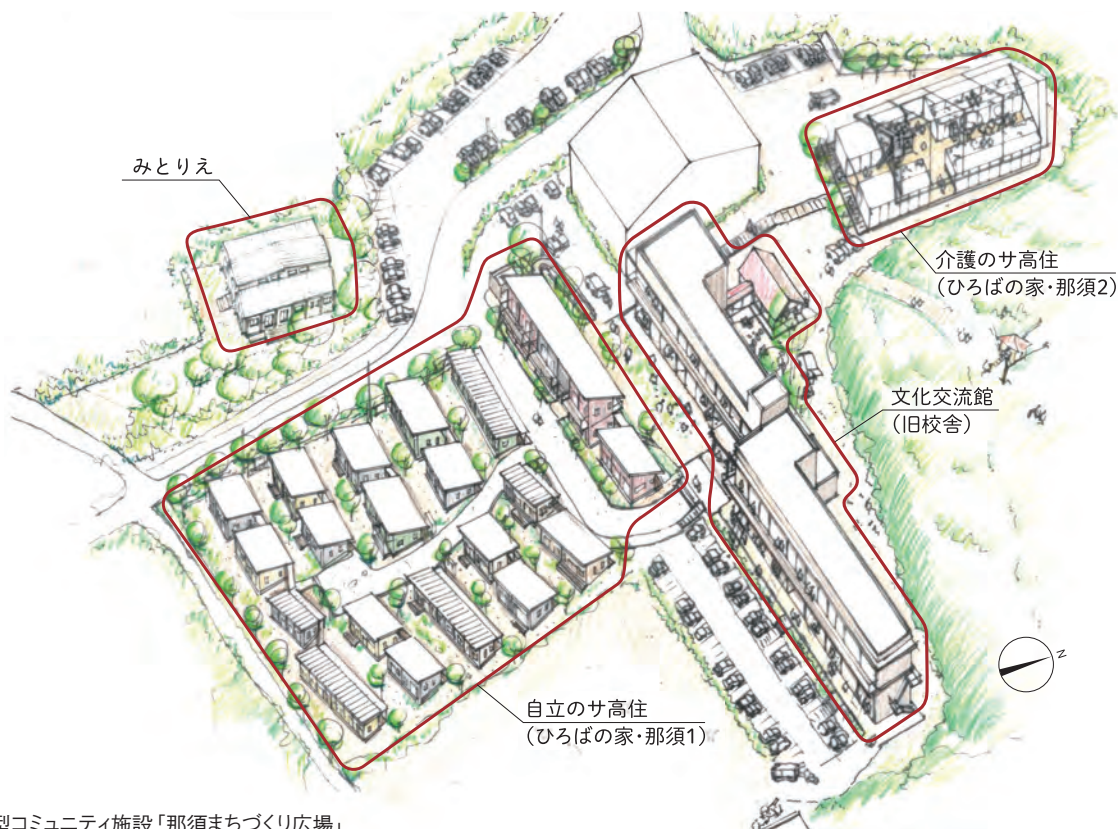
図1 共生型コミュニティ施設「那須まちづくり広場」

ミュニティネットワーク協会(1999年設立)の活動を通じて、全国各地でまちづくり事業を行ってきました。2006年に「那須100年コミュニティ構想」を立ち上げ、2010年開設したサ高住「ゆいま〜那須」【註】を中心