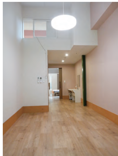
写真7(左上) 介護のサ高住「ひろばの家・那須2」全景、写真8(左下) 同・ホール、写真9(中央上) 同・ホール天井空間ロフト、写真10(右上) 同・内部、写真11(右下) 同・室内