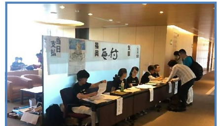
入念にチェックされた名簿で、スムーズな受付

すべての講座で100名超が聴講(Max127名)。どの講座も好評でした。1日目の大交流会105名、2日目の懇親会79名。