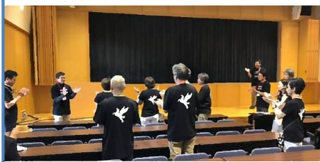
最後に、交流会に備えて「祝いめでた」「博多手一本」の練習