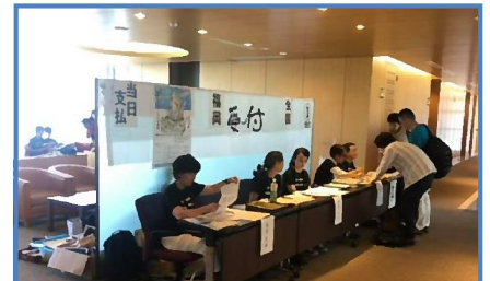
入念にチェックされた名簿で、スムーズな受付

すべての講座で100名超が聴講(Max127名)。どの講座も好評でした。1日目の大交流会105名、2日目の懇親会79名。