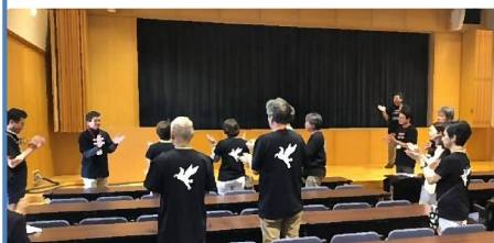
最後に、交流会に備えて「祝いめでた」「博多手一本」の練習